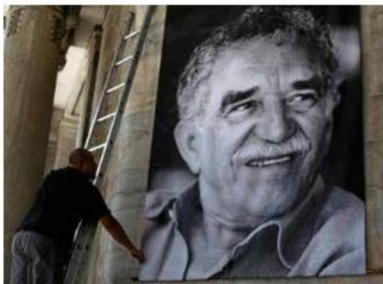
Nobelprisvinneren og den folkekjære forfatteren Gabriel García Márquez døde den 17. april 2014.

Les i morgen. Mange vil redde gamle hus. Private givere har kastet seg på den ferske «gaveforsterkningsordningen». Les på ap.no