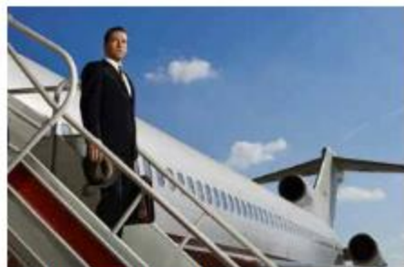
Relsen er snart slutt den mystiske Don Draper.

Kilde: Øystein Schjetne, illustrert av en dattelmaler: García Márquez' møte med nobelprisvinneren