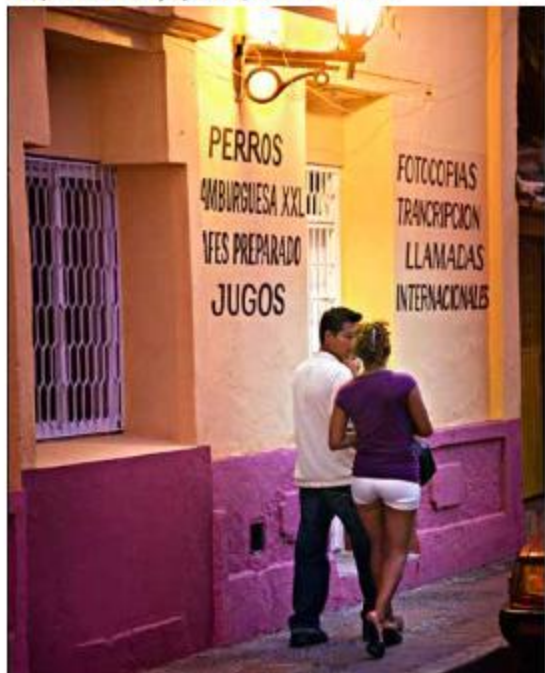
Byen Valledupar er sentrum for vallenatomusikken.

de nære venner, og forfatteren var en av initiativtagerne til den årlige vallenato-festivalen som trekker til seg 70-80.000 tilreisende.